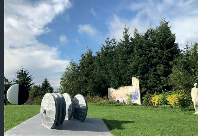
Themenraum „Krieg und Frieden“ im Skulpturenpark PAMPIN mit Installationen von Wieland Schmiedel / Wolf Art / Utz Brocksieper / Rainer Fest

6. PAMPINALE 2022 POSITIONEN ZEITGENÖSSISCHER KUNST