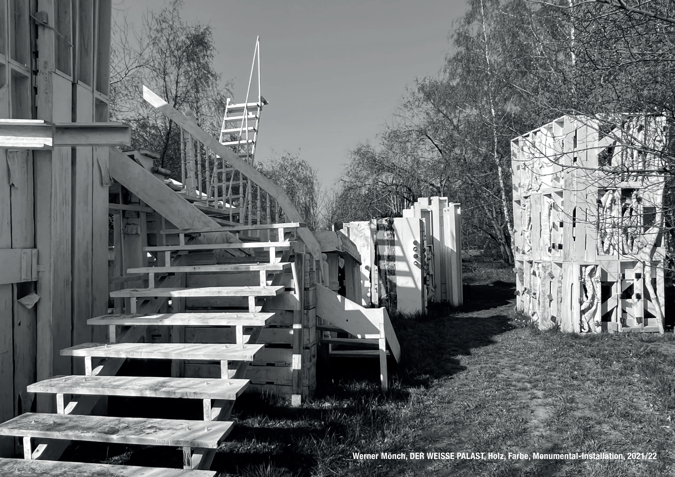
Werner Mönch, DER WEISSE PALAST, Holz, Farbe, Monumental-Installation, 2021/22