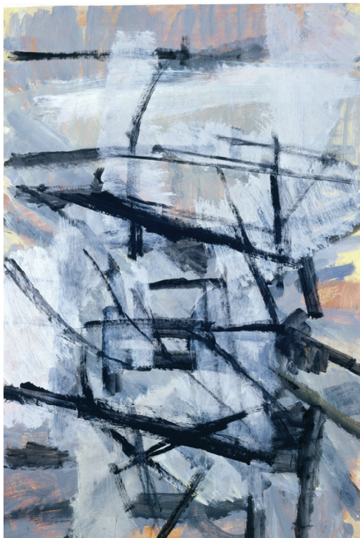
stadt-küste, Tempera/Papier, 2000, 116 x 85 cm