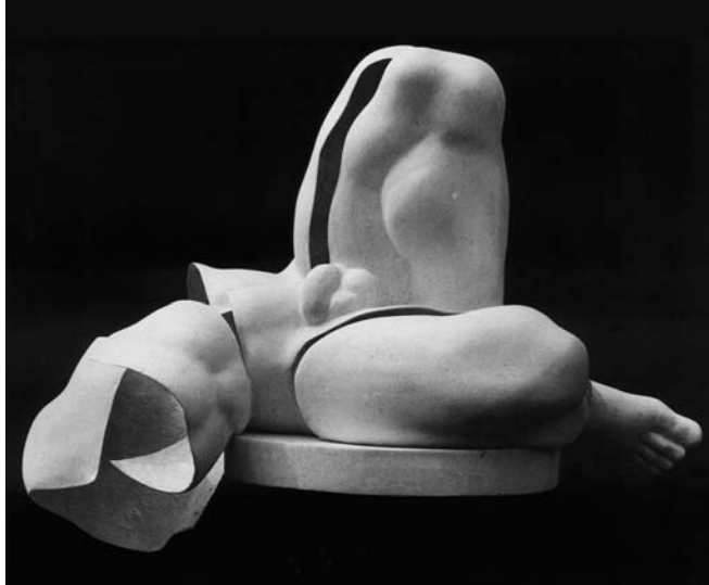
MARS II 1978/1985 Polyester 43x80 cm

„... in die Zeit der Zerstörung und des Zusammenbruchs geboren, aufgewachsen in einer zunächst hoffnungsvollen Zeit der Erneuerung, die alsbald im Farbenspiel rivalisierender Ideologien versank, war ich immer wieder angehalten, die Freiheit in mir selbst zu suchen...“