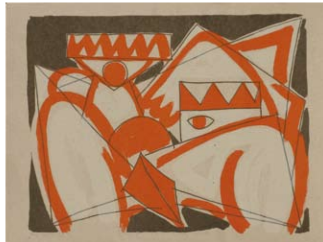
KÖNIGIN UND KÖNIG 1996 Dreifarben-Siebdruck 64x85cm