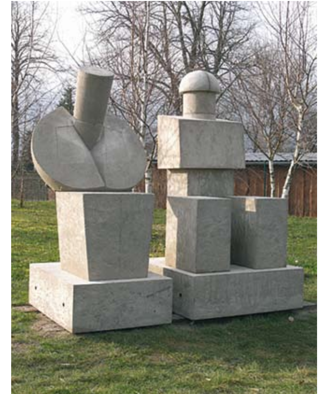
DAS PAAR 2009 Beton 175x170 cm

Die Ausstellung zeigt neueste Werke und einen Querschnitt durch das komplexe Schaffen Schmiedels. Dieses erstreckt sich zwischen den existenziellen Dimensionen von Liebe und Leid, Verletzlichkeit und Tod, Unterdrückung und Macht. Die scheinbare Heterogenität weist Verbindungslinien auf, die in einem Krafffeld zusammenfließen und ein Kontinuum darstellen. Seine Arbeiten sind ohne Schmuck und Schnörkel. Naturgetreue Abbilder sind nicht seine Sache, sondern das Freilegen der Substanz.