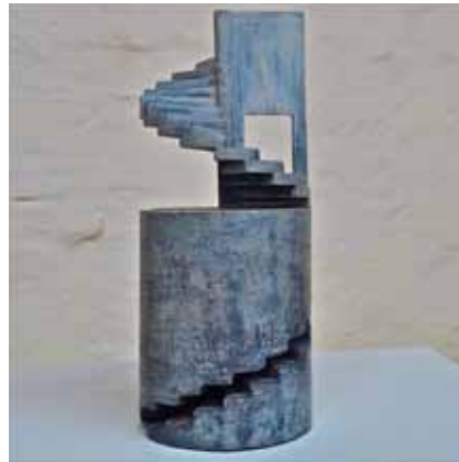
„o.T.“ Betonguss 2003