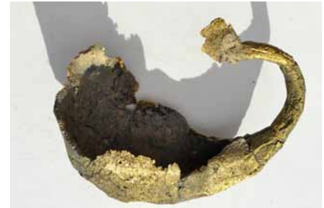
Geburt des Orouborus Messingguss (aus der Serie ARTEFAKTE 2012)

Im Skulpturenpark sind beeindruckende Objekte aus Stein (Granit, Blauer Labrador und Span. Syenit) aufgestellt, die sofort als Fest-Werke erkennbar sind. Stelen, Brunnensteine, Positiv-Negativ-Treppen zeigen die typische Handschrift des Steinbildhauers. Mit der Installation „Jericho, oder irgendwo anders“ ist ein frühes Schlüsselwerk des Künstlers zu bewundern, das auf Dauer in Pampin verbleiben wird. Diese Skulpturengruppe, die schon im Hamburger Bahnhof in Berlin zur Zeit des Mauerfalls ausgestellt war, besteht aus acht (ehemals 12) großen Granitwegplatten, die kreisförmig angeordnet sind und gegen den Uhrzeigersinn immer mehr von der vertikalen in die horizontale Lage fallen. Diese vielschichtige Installation kann gegensätzlich gelesen werden als ein Prozess des Aufrichtens oder des Umfallens, als Zyklus allen Lebens, als Symbol für die Unendlichkeit - ohne Anfang und ohne Ende.