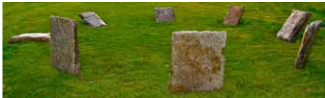
Jericho, oder irgendwo anders Granit, Berliner Gehwegpflaster, 1989 (Berlin) 2012 (Pampin)

All seine Werke reflektieren die Wertschätzung des Materials, das Fest immer mit Respekt und Präzision bearbeitet, um seine Ideen mit möglichst minimalen Eingriffen zu realisieren. Diese bedachte Wahl von Material und Schnitten verleiht seinen Werken eine zeitlose Wertigkeit. Insbesondere die oft archaisch anmutenden Objekte aus Stein strahlen eine Ruhe aus, als seien sie für die Ewigkeit gemacht. Sie (ver)föhren den Betrachter zur Kontemplation: Woher kommen wir - wohin gehen wir - wo ist unser Weg?