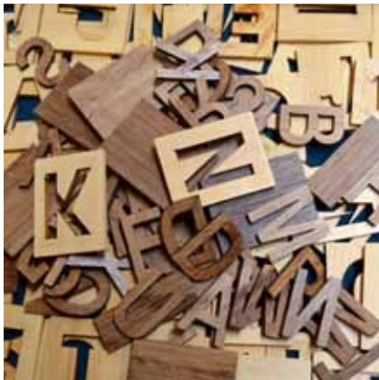
Schreibe den Wunsch (Detail) Holz 2005