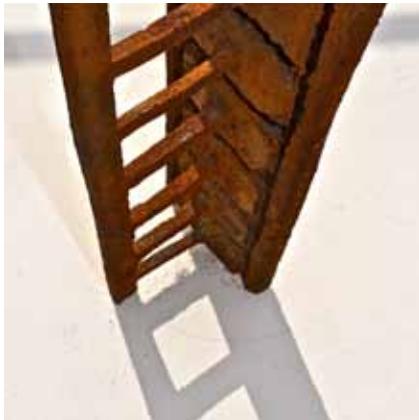
Jacobs Wunderwerkstatt (Detail) Eisenguss 2010