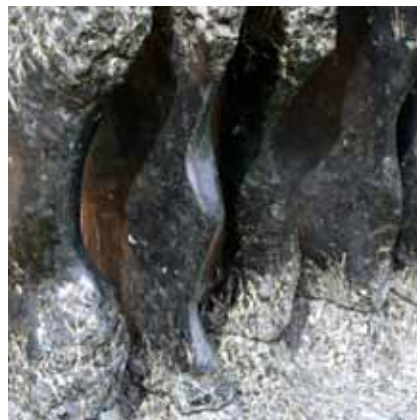
Der Himmel auf Erden Blauer Labrador 2008