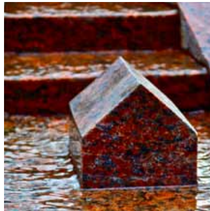
Brunnenstein (Detail) Wangagranit 2003