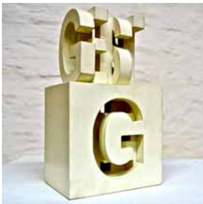
Geist Birke 2005